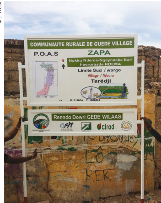
Information des usagers sur les règles POAS appliquées à une zone

aussi services techniques décentralisés et porte-paroles des différents groupes d'usagers dans les commissions de zone. À cela il faut ajouter un investissement important dans la communication à travers des outils simples et didactiques en langues locales (vidéos, documents illustrés, etc.) et la mobilisation des radios communautaires.